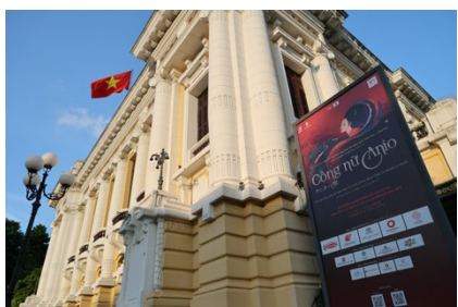
ハノイオペラハウス外観