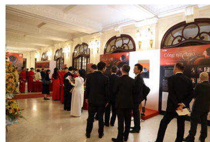
オペラハウス ロビーの様子