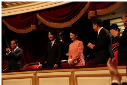
ご鑑賞される 秋篠宮殿下、紀子妃殿下

アニオー姫と荒木宗太郎をはじめとするキャストたちの圧巻のパフォーマンス、そして本名徹次率いる VNSO の演奏に、3 日間を通して会場は感動の声と喝采に沸きました。カーテンコールは両国のパートナーシップを象徴するような親密さに溢れ、観客から最大の賛辞が送られていました。