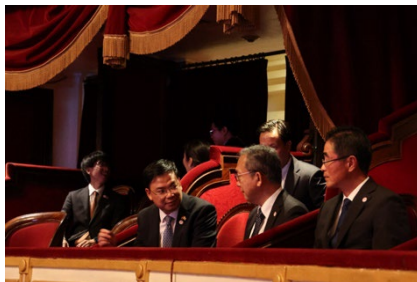
ベトナム社会主義共和国 副首相 チャン・ルー・クアン氏